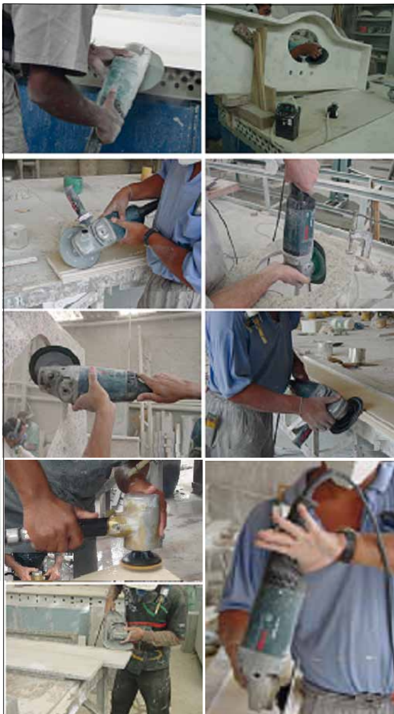
Figura 3 Ilustração de diferentes posturas e empunhaduras dos operadores durante rotinas de trabalho operando ferramentas manuais