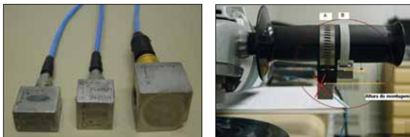
Figura 4 (a) Exemplo de montagens de acelerômetros triaxiais; (b) Exemplo de tipos de acelerômetros triaxiais

Sempre que possível, o acelerômetro deve ser fixado diretamente à superfície vibrante por meio de prisioneiro. Outra alternativa é a fixação do acelerômetro em um cubo metálico, que deve ser pequeno e leve tanto quanto possível. Este conjunto deve ser acoplado à superfície vibrante por meio de abraçadeiras metálicas ou plásticas. A Figura 4(a) tem apenas o objetivo de exemplificar duas formas de montagens. A montagem “A” não é recomendada devido à maior distância entre o acelerômetro e a superfície vibrante. A montagem “B”, além de aproximar o acelerômetro da superfície vibrante, resulta em menor massa por utilizar acelerômetro de menor tamanho e abraçadeira mais leve. A Figura 4(b) ilustra alguns tipos de acelerômetros triaxiais.