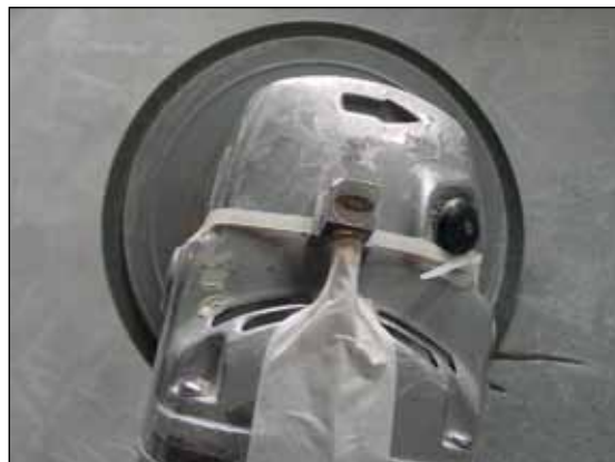
Figura 5 Ilustração de montagem em situações nas quais o operador não utiliza o punho auxiliar da ferramenta

A Figura 5, mostrada a seguir, apresenta uma situação de montagem e posicionamento do acelerômetro em uma condição de trabalho na qual o operador não faz uso do punho auxiliar da ferramenta, uma vez que segura diretamente no corpo dela. A mesma figura também ilustra uma forma de fixação do acelerômetro e de proteção da conexão e do cabo elétrico.